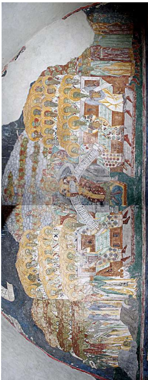
Photo 3. Représentation du concile, monastère d'Arbore.