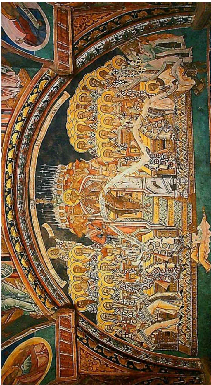
Photo 1. La vision de saint Pierre d'Alexandrie, monastère de Probota.