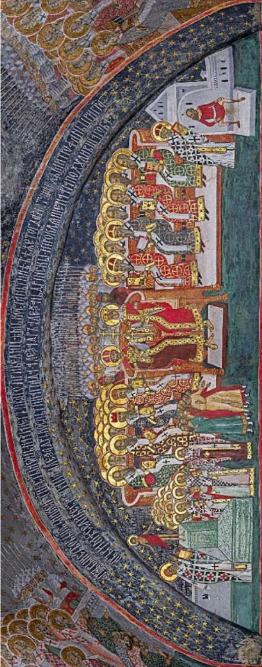
Photo 2. Les empereurs Constantin et Hélène, monastère de Sucevița.